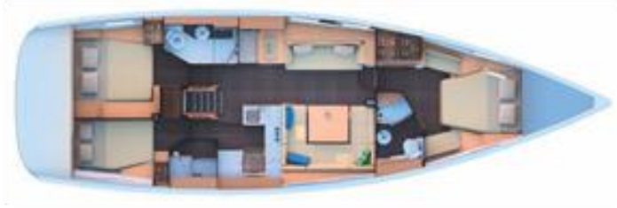
3 Kabin versiyonu : 2 WC