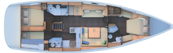
2 kabin versiyonu : 3 WC+skipper kabin

Bu dökümanın herhangi yasal bir bağılayıcılığı yoktur ve ekipman veya özelliklerini haber vermeden deęiřtirme hakkımız saklıdır. Ekim 2019'da güncellenmiřtir.