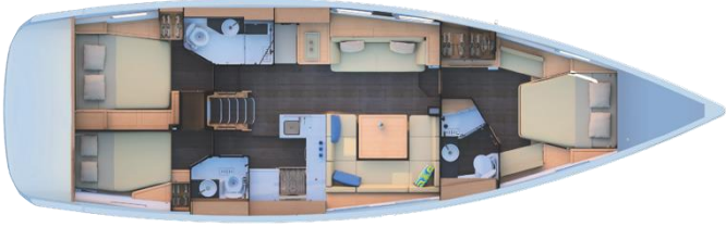
3 kabin versiyonu : 3 WC