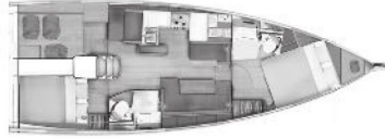
Versiyon B Baş Master Kabin 1 Kıç Kabin / 2 WC

(Baş Master kabinde Giyinme odası ve mobilyalı lavabo opsiyon olarak mevcuttur)