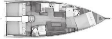
Versiyon D Baş Master Kabin 2 Kıç Kabin / 2 WC

Baş Master kabinde Giyinme odası ve mobilyalı lavabo opsiyon olarak mevcuttur )