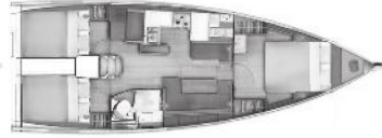
Versiyon C Baş Master Kabin 2 Kıç Kabin / 1 WC

Baş Master kabinde Giyinme odası ve mobilyalı lavabo opsiyon olarak mevcuttur )