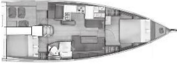
Versiyon A Baş Master Kabin 1 Kıç Kabin / 1 WC

(Baş Master kabinde Giyinme odası ve mobilyalı lavabo opsiyon olarak mevcuttur)