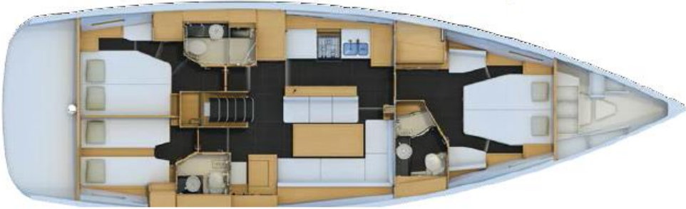
3 Kabin Versiyonu: Baş Master Kabin, VIP Kıç Kabin, Kıç Misafir Kabini (Opsiyonel Kaptan Kabini)