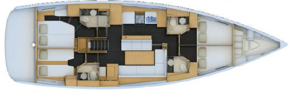
4 Kabin Versiyonu: 2 Dönüştürülebilir Baş Kabin, VIP Kıç Kabin, Kıç Misafir Kabini (Opsiyonel Kaptan Kabini)